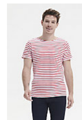
SOL'S MILES MEN 01398