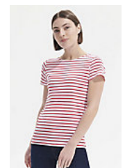
SOL'S MILES WOMEN 01399