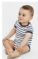
SOL'S MILES BABY 01401